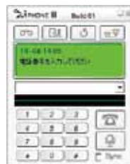
ソフトフォン(標準添付)